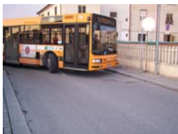
1. Nuova Viabilità