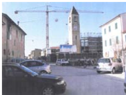
6. Piazza di Putignano - Prima e dopo